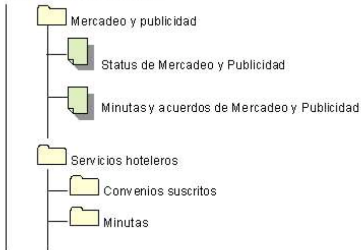
Figura 1: Ejemplo del árbol de documentos